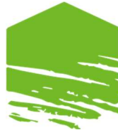
Схема Індивідуального плану модернізації (ІПМ)